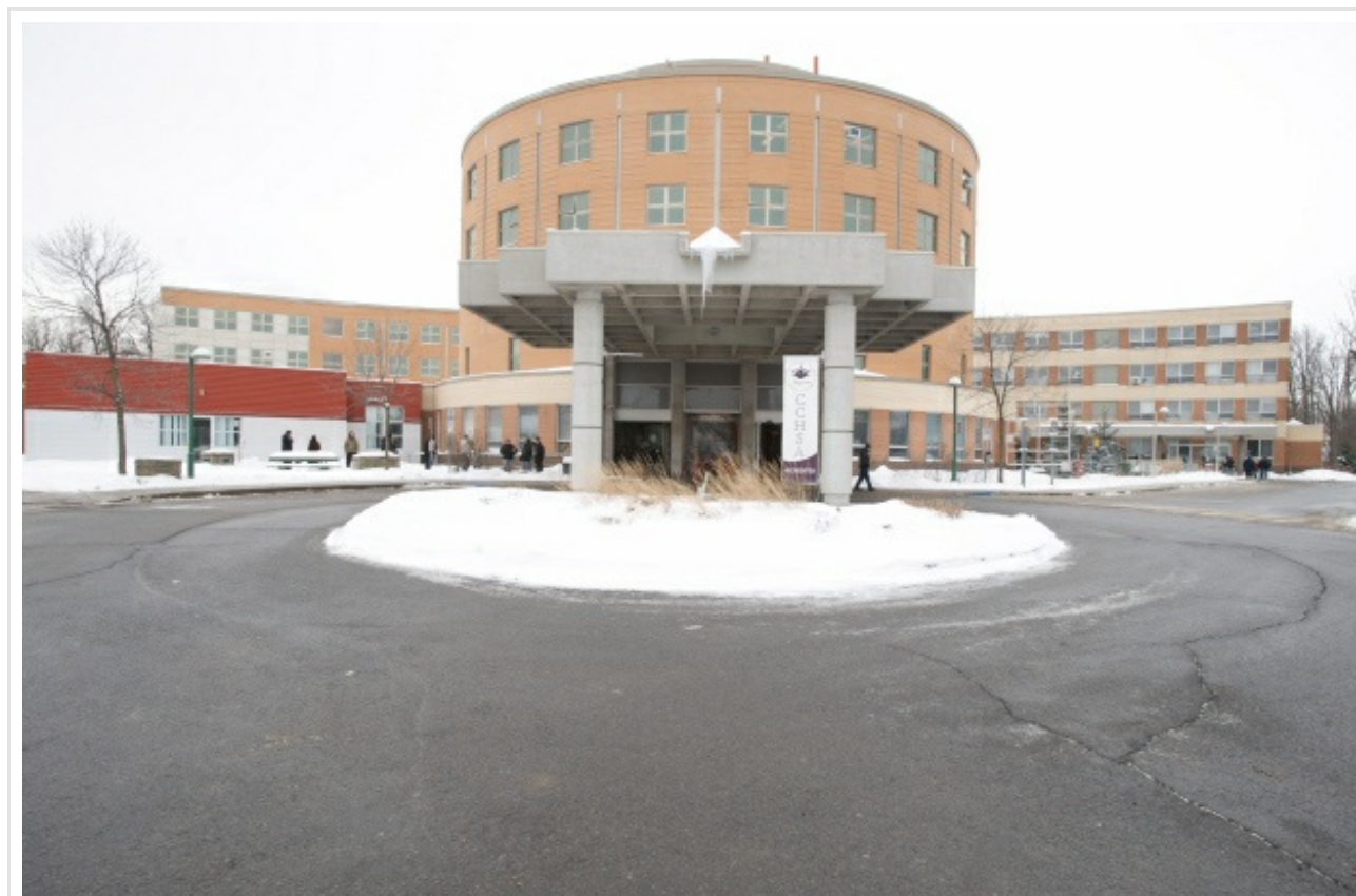
L'Hôpital Lakeshore recevra 30 lits supplémentaires d'ici avril prochain.